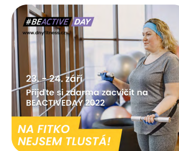
Vizuály pro kampaň #BEACTIVEDAY na sociální síť